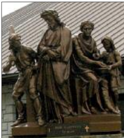
Križev pot v Midlandu, 1. postaja

njihove vere. Njihova kri ne vpije po maščevanju, temveč po iskreni spravi z Bogom in med rojaki. Kri mučencev naj bi bila seme za novo versko in narodno pomlad v Sloveniji ter povsod, ker biva naš slovenski rod.