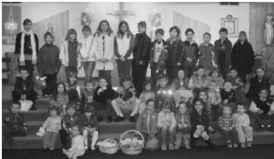
Troci iz župnije sv. Vladimirja v Montrealu pri blagoslovu velikonočnih jedil